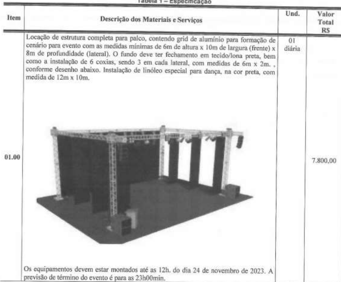
Tabela 1 – Especificação