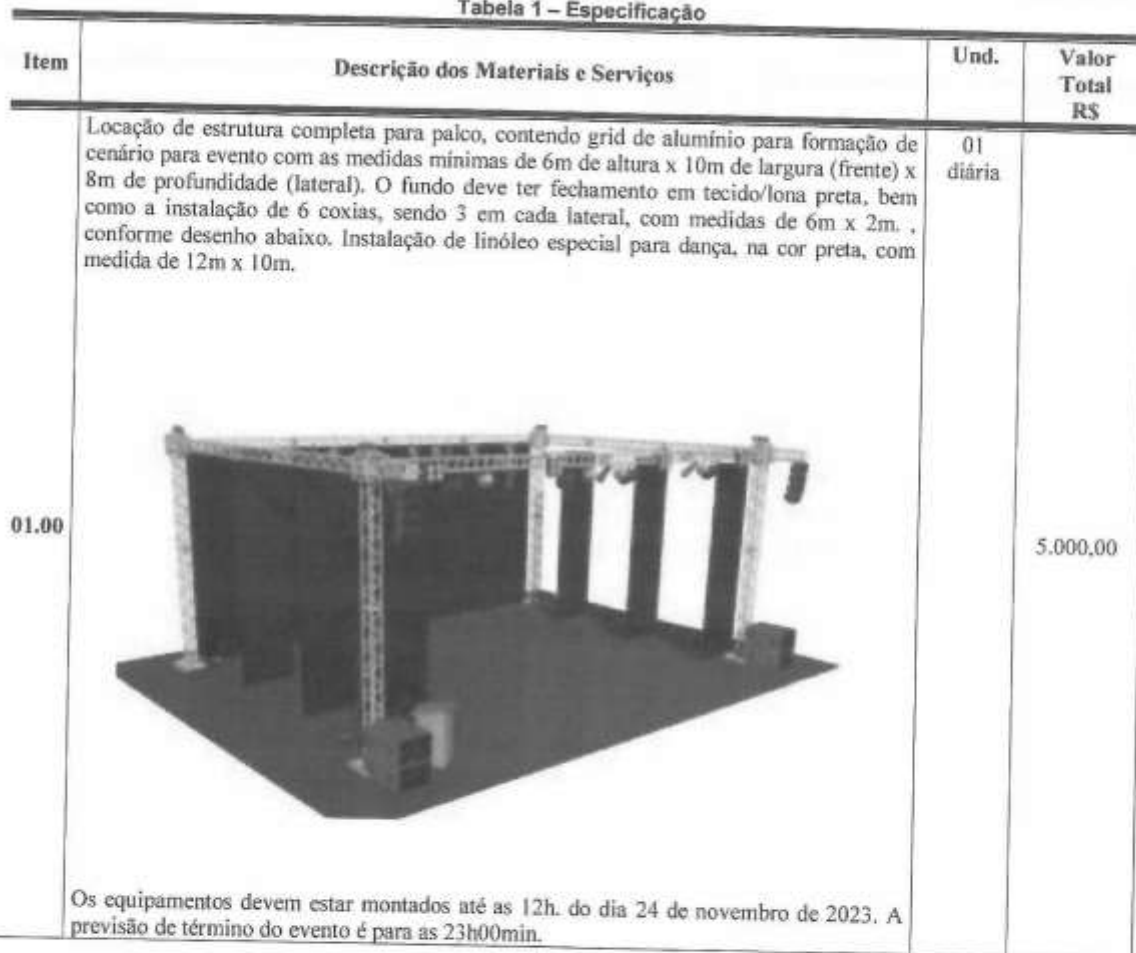
Tabela 1 – Especificação