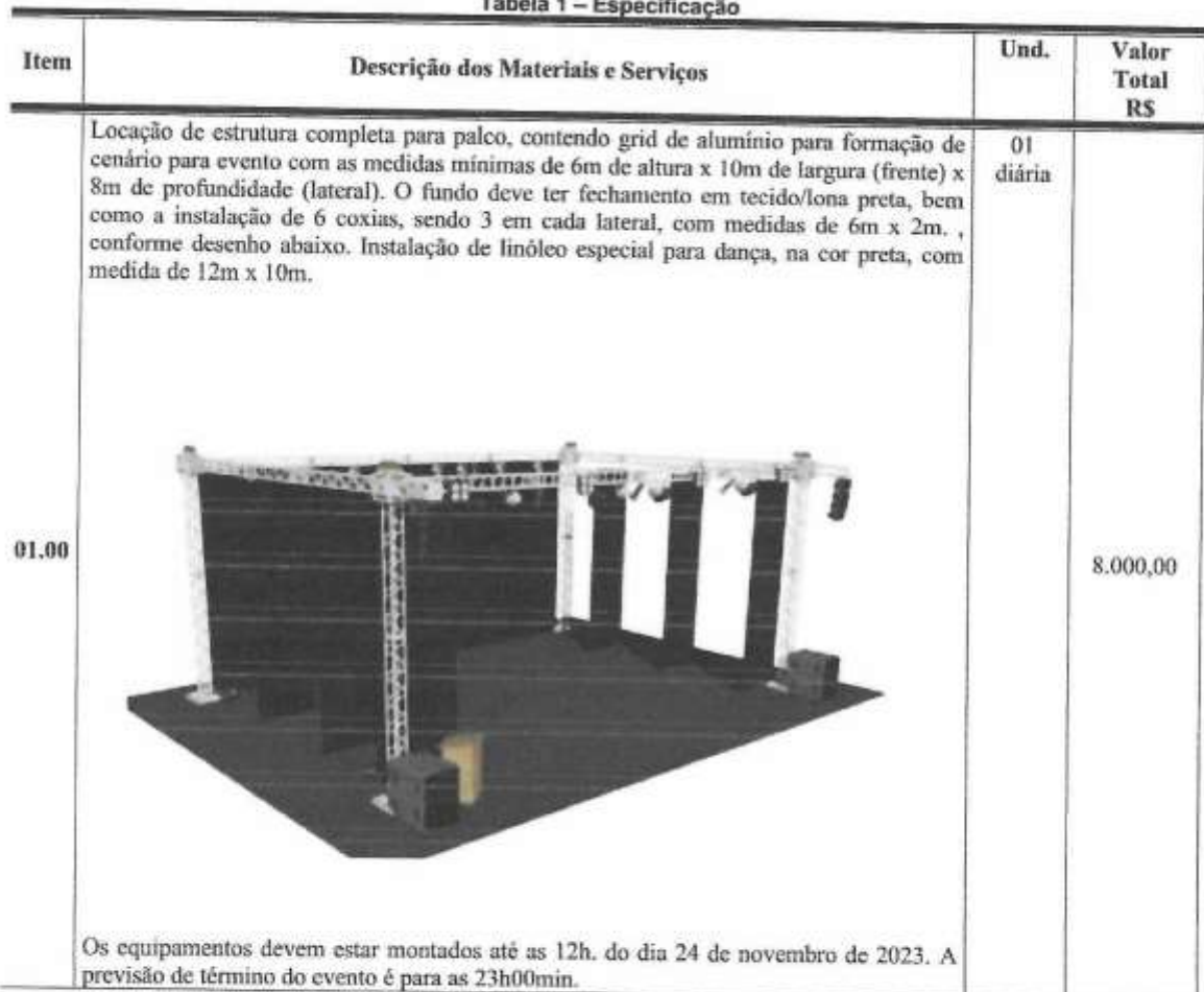
Tabela 1 – Especificação